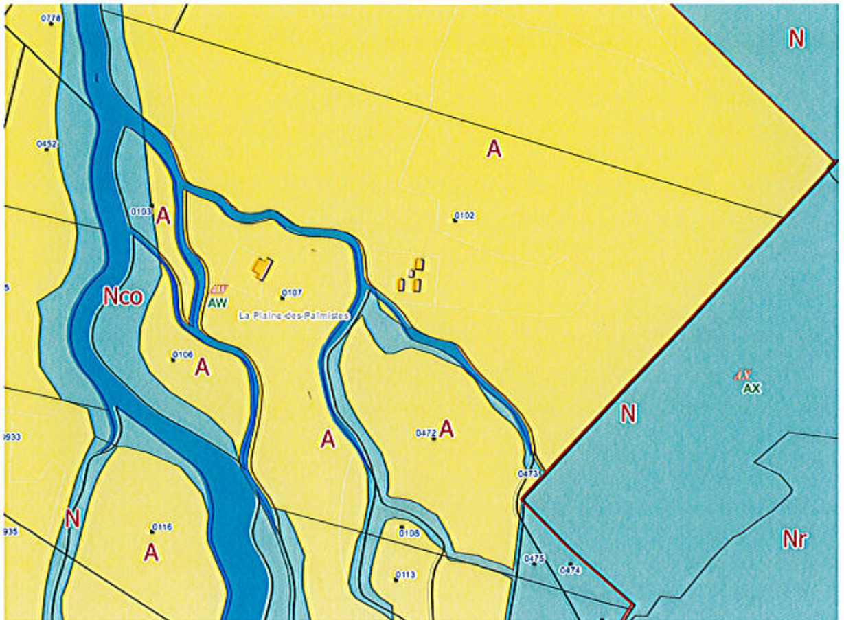
Le zonage du PLU

Suite aux divers échanges, Mme NATIVEL propose de vendre à la Commune les parcelles AW 472 (ancien 109), 473 (ancien 110), 102 et 108 pour une superficie totale de 18ha62a75ca à 120 000 €, soit environ 6 500 € l'hectare.