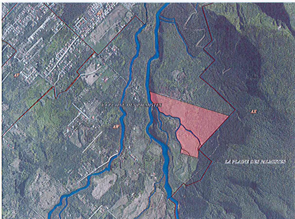
Plan de situation des terrains